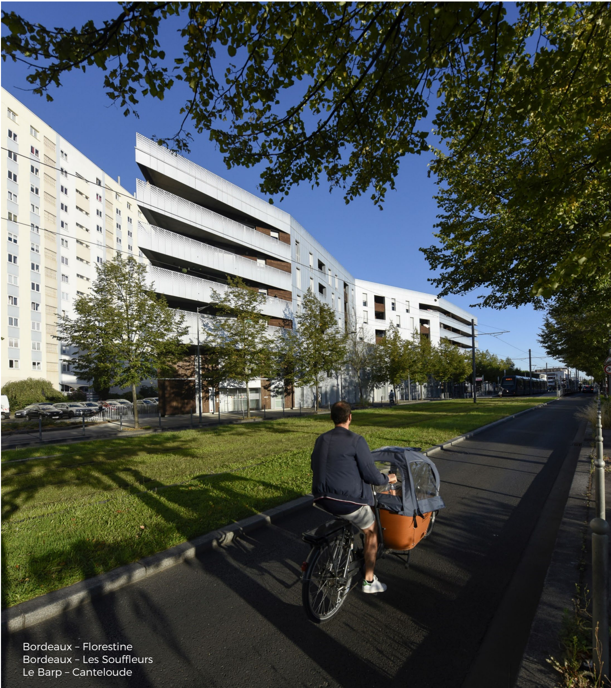
Bordeaux - Florestine Bordeaux - Les Souffleurs Le Barp - Canteloude