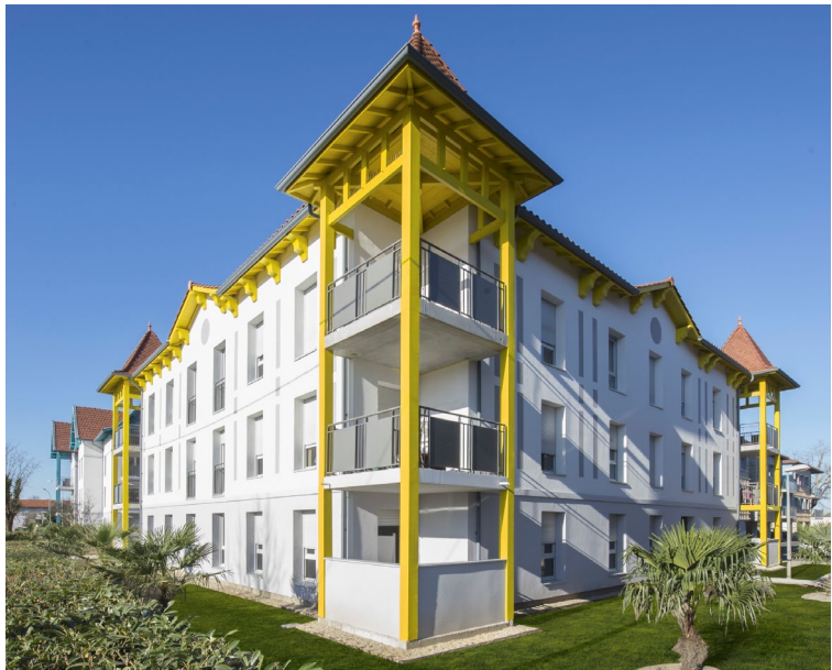
Eysines – Les Longères de Carès Floirac – Florus La Teste de Buch – Le Canter / Les Galops Gujan Mestras – Les Parqueurs